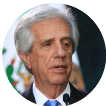
Dr Tabaré Vázquez, Presidente de Uruguay